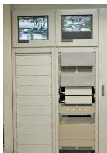
ネットワークディスクレコーダーが納められたシステムラック

て見ることができます。画像は30枚/秒でデジタルディスクレコーダーDG-ND400に1ヵ月間保存され、必要に応じて画像を検索・事後検証できるようになっています。さらに、監視エリア内の動きを検知するとアラームで異常を知らせるモーションディテクターにより、夜間監視の負担を飛躍的に減らしています。