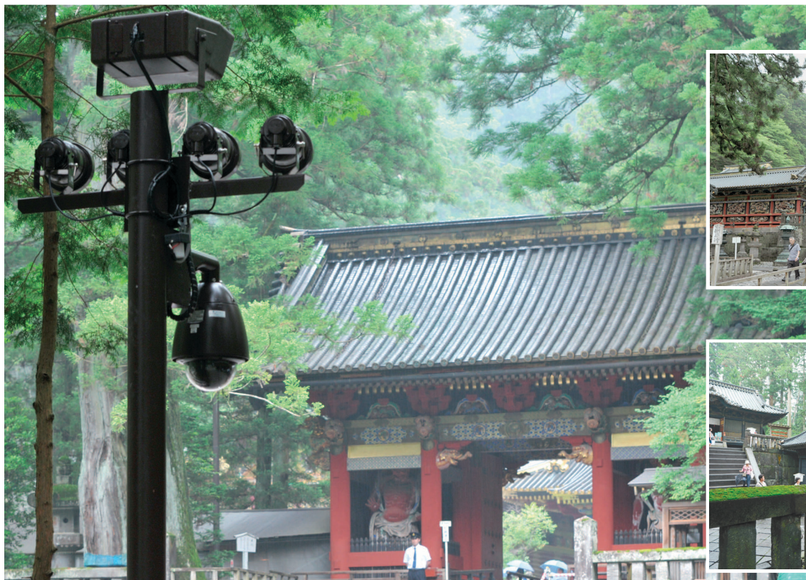
日光東照宮の表門を見守るネットワークカメラ