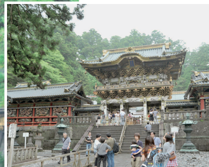
国内外からの参拝者でにぎわう 国宝・陽明門前