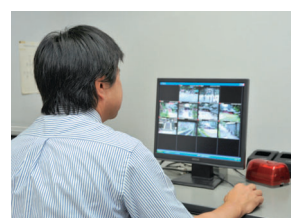
DG-ASM100/L2をインストールしたパソコンから、カメラのコントロールも可能

撮影された画像は警備室のシステムラックに設置された2台の液晶モニターに、ライブ画表示専用ソフトウェアDG-ASM10を用いて分割表示され、警備員によりライブモニタリングされています。また、職員のパソコンからもアクセスし