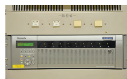
ネットワークディスクレコーダーDG-ND400