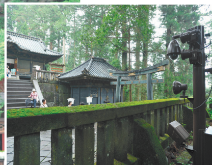
家康公が眠る奥宮俳殿にも設置

世界遺産にも登録され、国内外から年間180万人もの参拝者が訪れる日光東照宮様ではこの度、夜間監視を主目的にネットワークカメラシステムアイプロ (i-PRO) シリーズを導入。参拝者が安心して拝観できる環境づくりに生かされています。